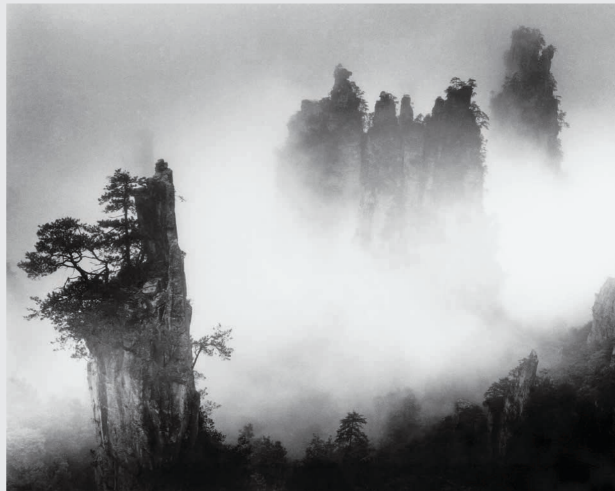
父亲亲手在暗房制作的最后一张作品《烟雨天子山》(2012年)